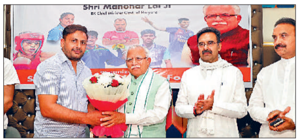
हरियाणा के पूर्व मुख्यमंत्री मनोहर लाल का स्वागत करते हुए।

करनाल। हरियाणा के पूर्व मुख्यमंत्री एवं करनाल लोकसभा से भाजपा प्रत्याशी मनोहर लाल बुधवार को सुमित नरवाल वेलफेयर फाउंडेशन की ओर से करनाल क्लब में आयोजित कार्यक्रम में पहुंचे और अंतराष्ट्रीय, राष्ट्रीय एवं स्थानीय खिलाड़ियों से मुलाकात की। पूर्व मुख्यमंत्री मनोहर लाल ने खिलाड़ियों का हौसला बढ़ाया और कहा कि प्रदेश सरकार ने हमेशा खिलाड़ियों का साथ दिया है और खेलों को बढ़ावा देने का काम किया है। मनोहर लाल ने कहा कि खेल के क्षेत्र में हरियाणा का प्रदर्शन बेमिसाल रहा है। हर खेल में यहां के खिलाड़ियों ने कमाल किया है। सरकार ने खिलाड़ियों को तयार करने के लिए स्कूल स्तर से ही उन्हें प्रोत्साहन देने के लिए कई