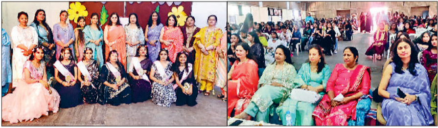
अंबाला। गेट टू गेदर में टाइटल पाने वाली छात्राएं व कार्यक्रम में मौजूद शिक्षक।

भाजपा संविधान बदलने की साजिश रच रही है। इस पर पलटवार करते हुए उन्होंने कहा कि भाजपा सबसे ज्यादा संविधान को मानती है क्योंकि भाजपा का घोषणा पत्र तब जारी हुआ जिस दी संविधान निर्माता बाबा साहेब भीम राव अम्बेडकर का जन्म दिवस था और ये (कांग्रेस) बात संविधान की करते है जिन्होंने बाबा साहेब के बनाये संविधान को पैरो तले रौंदा उन्होंने फिर दोहराया कि इंदिरा गांधी ने एमरजेंसी लगाई और सारे मौलिक अधिकारों को कुचल दिया। उन्होंने कहा कि कई महीने लाखों लोगो को जेल में डाल कर रखा और चुनी हुई सरकारों को धर 356 लगाकर ऐसे तोड़ा जैसे बच्चा खिलोने तोड़ता है।