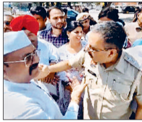
विरोध करने पहुंचे कांग्रेस नेताओं को हिरासत में लेती पुलिस।

पूर्व मुख्यमंत्री मनोहर लाल के अध्यापक संवाद कार्यक्रम का विरोध करने पहुंचे कांग्रेस नेताओं को पुलिस ने गिरफ्तार कर लिया। कांग्रेस नेताओं की अगुवाई जिला अदालत के नियमों को ताक पर रख कर किया